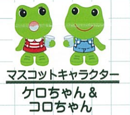
マスコットキャラクター ケロちゃん & コロちゃん

興和株式会社は、CSR(社会貢献活動)の一環として、災害時の物資支給等の協力を行うこととしており、普段から地域防災リーダーとしても参加いただいています。平成27年度のあさがおフェスタでは、ふれあいバザーに出品協力もいただきました。