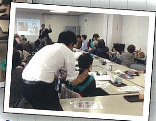
ふれあいマッサージ