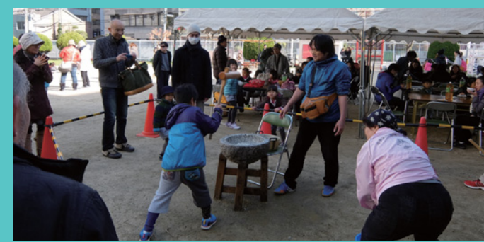
南船場もちつき大会

夏休み期間中、お隣の芦池地域と合同で開催しています。地域の子どもも大人も一緒に音楽に合わせて元気いっぱいラジオ体操をすることで、健康づくりや世代交流のきっかけになることを目指しています。