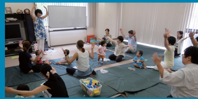
南船場子育て応援団

毎月1回女性会会員から参加者を募り、長堀通界隈の歩道、植え込み等の清掃をしています。コミュニティカ や環境問題への意識向上を図り、まちの美化と活性化につなげることを目指しています。