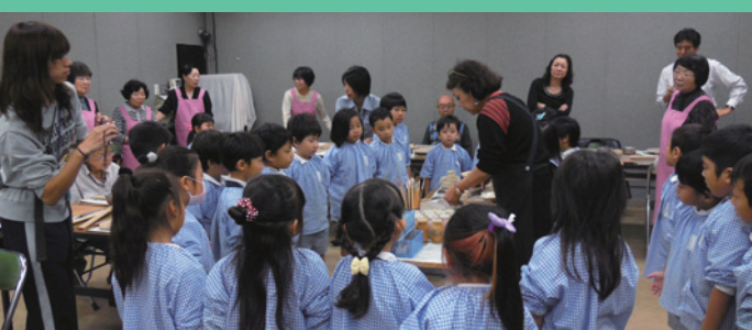
11月 世代間交流(南幼稚園児との交流会)