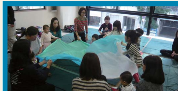
南船場子育て応援団

毎月1回女性会会員から参加者を募り、長堀通界隈の歩道、植え込み等の清掃をしています。コミュニティー力や環境問題への意識向上を図り、まちの美化と活性化につなげることを目指しています。