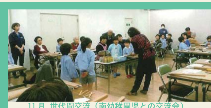
11月 世代間交流（南幼稚園児との交流会）

ボランティアの協力のもと、高齢者だけでなく、全世代の健康づくり、生きがいの支援、相談をしています。11月の世代間交流では、南幼稚園の子どもたちと、ものづくりを通じて交流します。