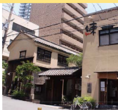
お屋敷再生複合ショップ