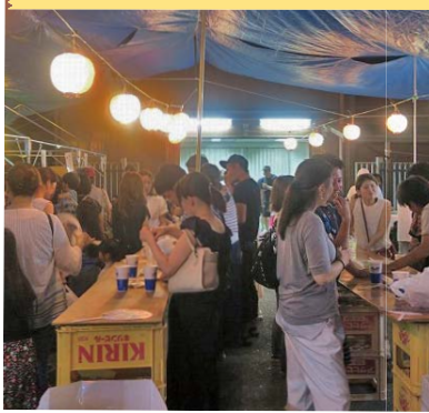
納涼ビアガーデン