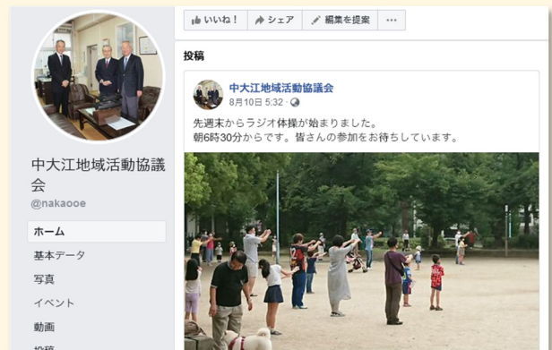
フェイスブックでの情報発信

中央区まちづくりセンターホームページ https://chuoku-machisen.jimdo.com