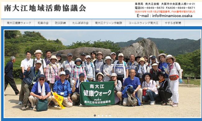
ホームページでの情報発信